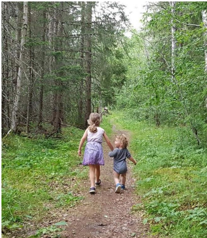
Fra «Snåsaturliv» i regi av Trimgruppa, Snåsa IL.

Resultatene fra denne planen skal innarbeides i kommunedelplan for idrett og fysisk aktivitet og gis sin planforankring der. Prosjektet er politisk forankret av hovedutvalg teknisk, landbruk, miljø, utvikling og næring i møte 14.06.2021.