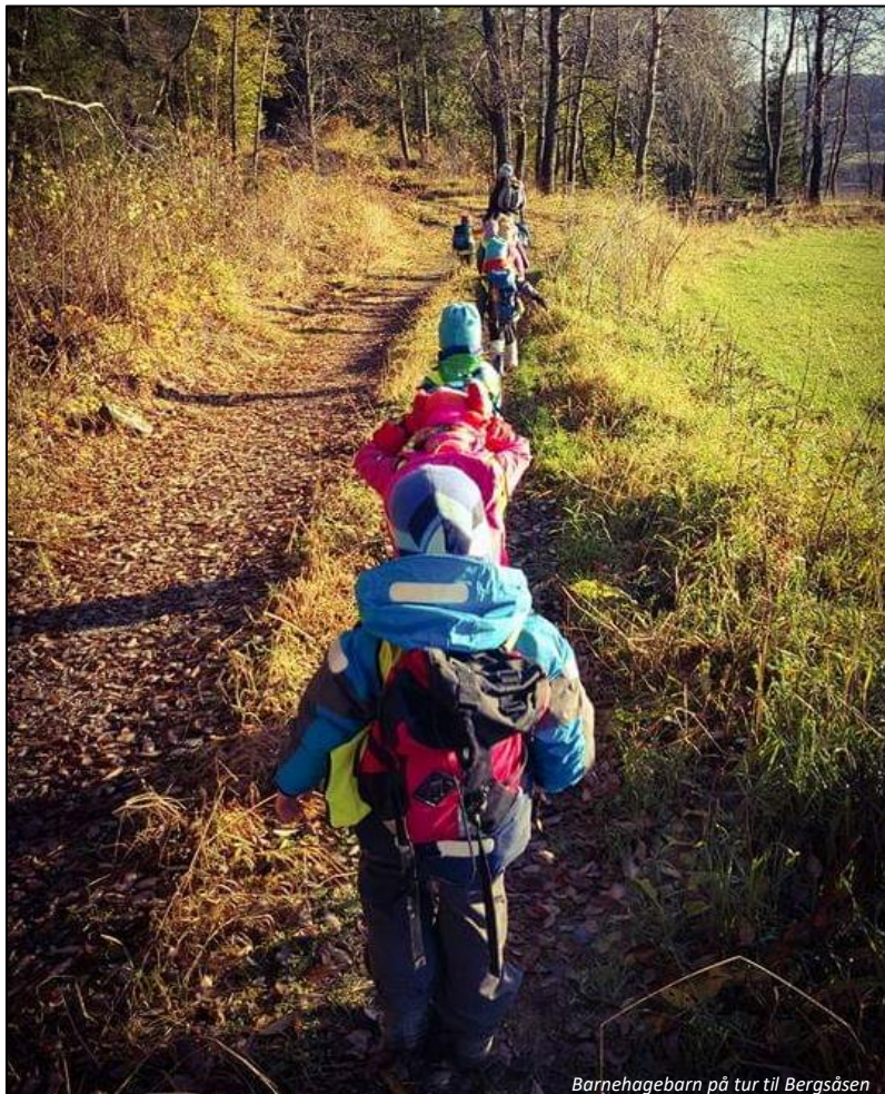
Barnehagebarn på tur til Bergsåsen